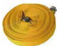
Amarilla doble chaqueta 1'1/2 y 2'1/2 Pulgadas