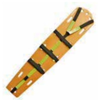
TIPO ARAÑA ARNES