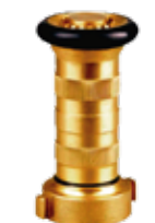
Boquilla en bronce chorro y niebla 1'1/2 pulgadas