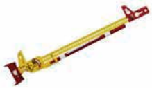
HI LIFT 4X4