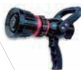
Boquilla importada 1'1/2 pulgadas, 2'1/2pulgadas bajo y altogalonaje