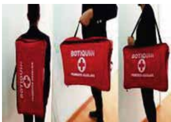
TIPO MORRAL EN LONA