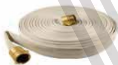
Manguera sencilla gavinetera 1'1/2 Pulgadas