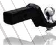
TIRO DE REMOLQUE