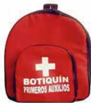
LONA TIPO MALETIN