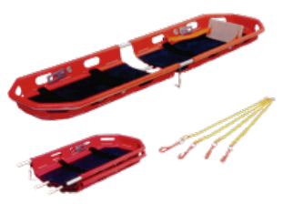
TIPO CANASTA CON ARNESA