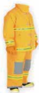
TRAJE NFPA ESTRUCTURAL